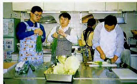
12月5日(星期日)樱地区市民中心在樱联合文化节上包饺子的情景

在周末,进修人员参加了当地居民的文化节,还和居民们一起包饺子等,进一步加深了民间的交流。