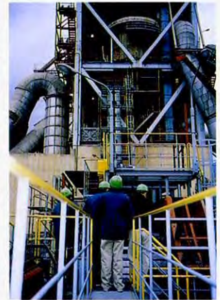
研究水泥工厂的废弃物再利用状况的进修人员

进修人员参观了产业废弃物的再利用和各种处理方法、城市垃圾焚烧设施和垃圾固形燃料(RDF)化设施、以及实现了无放射物的食品工厂等,进一步了解了日本对废弃物的处理方法。另外,还与日本的行政机关、企业专