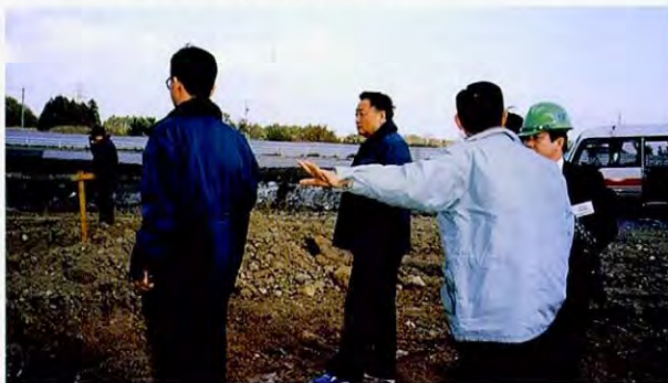
12月6日废弃物最终处理场的进修情景(MEC)

目前，天津市正在着手建设产业废弃物焚烧·填埋的综合处理设施，在这次的进修人员中，有很多人是从从事废弃物处理设施的设计和建设，或研究废弃物再利用等工作的，他们对焚烧设施产生的二恶英所采取的对策及填埋处理设施的防水工艺法等具体性的处理技术抱有很大的兴趣。另外，过去日常生活的垃圾均采用填埋来处理的方法，为了适应环境、社会、经济的变化，已开始着手建设焚烧处理垃圾的发电站。