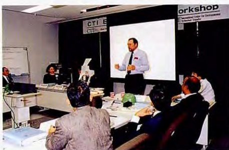
在日本举办的研究会议上的讨论情景

众所周知的大气温度年年在上升,大量的资料显示,人类的能源消费量的增大,可能是造成温度上升的原因。为了防止地球温室效应,人类必须对自己的活动进行自我约束。COP5的正式名称为“气候变化结构条约第5次缔约国会议”。为了防止因地球温室效应等的气候变化而造成的影响,于1992年开始了这项国际性活动。在京都举行的COP3会议上,首次讨论了2000年以后的环保问题。为了完善所谓京都机制的具体方策,在每年举行的COP会议上,各国都为调整本国的利益而进行了激烈的论争。