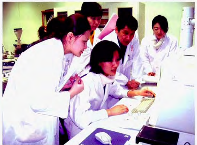
分析实习(地点:三重县保健环境研究部)

而在讲师的安排还象上年度一样,多聘请在生源国有过该领域指导经验的讲师,以期获得考虑了当地情况后的适当的建议,并开展师生间的双向培训。