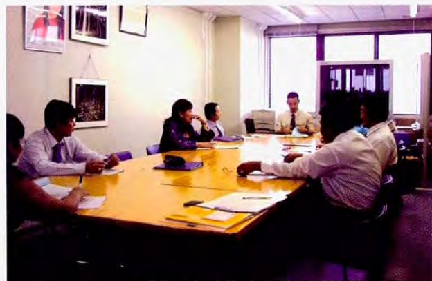
在三重县环境森林部听讲义

后半部分以介绍企业与行政方面具体的环境对策的活动为主。讲义包括公害防止协定、车辆尾气排放对策,并参观了三重县和四日市市的环境学习信息中心、大气环境测量局、企业的循环再利用制品厂等。之后,在作为“促进市民的环保意识”活动的一个例子,讲授了学校的环境教育的必要性,还参观了市里和NPO合办的循环再利用设施,参观了一家高中的独自的环保活动。培训员们对于绝大部分的设