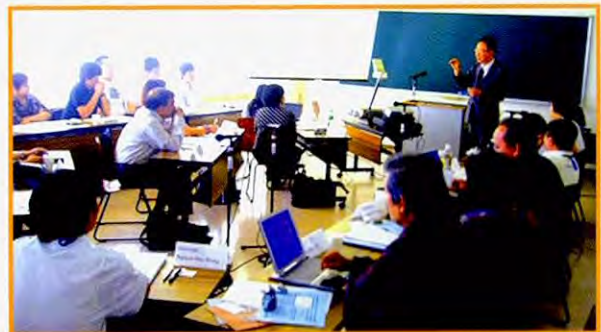
与四日市大学合作举办的研究会

由四日市大学环境信息系的教授们牵头,从学术界角度就地球环境问题与出席者交换了意见。还特别听取了与四日市缔结了姊妹友好城市关系的中华人民共和国天津市的土壤脱硫肥料适用收获反应技术,氧化硫活性度损益分析技术,工厂设备环境投资的经济性侧面等问题的讲座。出席者重新认识到四日市大学在中国所从事的脱硫技术是防止地球温暖化的“一个成功典