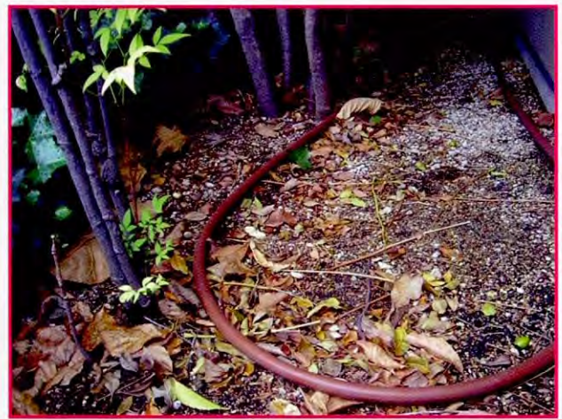
难波综合商用设施屋顶花园中水撒水装置 (雨水感知器长时间没有感知时,会从管道孔中自动渗水的“输液式撒水”)

培训人员最为关心的3个主题是,有关中水利用的实例、琵琶湖及伊势湾的水质改善工作、合并净化槽等的小型污水处理技术,热心地开展了一系列学习。特别提出象合并净化槽以及小社区用处理设备在设置与运营操作上比较简易,这类小型处理设施对于天津市郊区的农村集居村落的水环境改善有很大的意义。通过参加“地球环境塾”活动,充分认识到环境保护不仅仅是技术问题,从人们的意识上进行宣传启发也是非常重要。有几位培训人员在自己回国后的行动目标里写进了要在天津市开展环境教育,看得出他们深切感受到了技术和启发教育这两者的重要性。