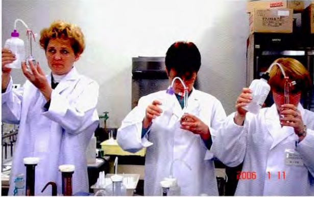
分析实习(地点:株式会社Techno中部)

很多培训员对于日常的分析业务掌握得非常熟练(其具体表现可以从得出分析误差极小的结果看出),也有些培训员马上用上了在秋叶原购买的精致的数码相机或摄像机,把实习中的分析操作顺序用动画拍摄下来,显示了要“把在培训中学到的经验分毫不差带回国去”的热情。