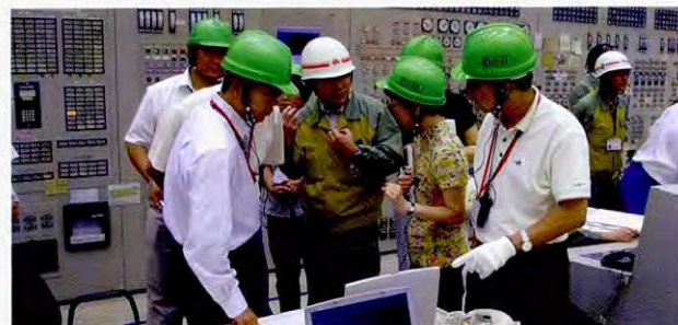
在中部电力(株)四日市火力发电所的控制室

培训师候选人还参加了2006年9月11日至15日所实施的参观考察活动,通过讲座和参观企业,加深了对日本环境对策和企业内资源能源节省及环保意识的理解。培训师候选人的感想如下:①日本企业对于环