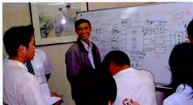
正在试点企业学习通过设备管理减低环境负荷的学员

在培训师的进修培训上是通过听讲和现场实习,以期有效培养将来为甘肃省政府和企业提供CP监查、培训等服务的人材。为了提高CP服务效果的目标,培训课程编排内容不仅在中国国内的CP及CP监查,也导入了被认为有助于提高CP服务效果的日本的资源能源节省经验和设备管理这类内容。同时,也让培训师候选人之间积极地展开讨论及小组调研,要求培训师候选人活用自己编制的教材实施对试点企业的CP监查等。总之,充分尊重培训师候选人的主体性是这项培训最大的特征。通过这样的培训,努力提高培训师候选人对CP及提高生产率活动的理解,同时培养他们作为培训师的实践能力和今后的自主性。