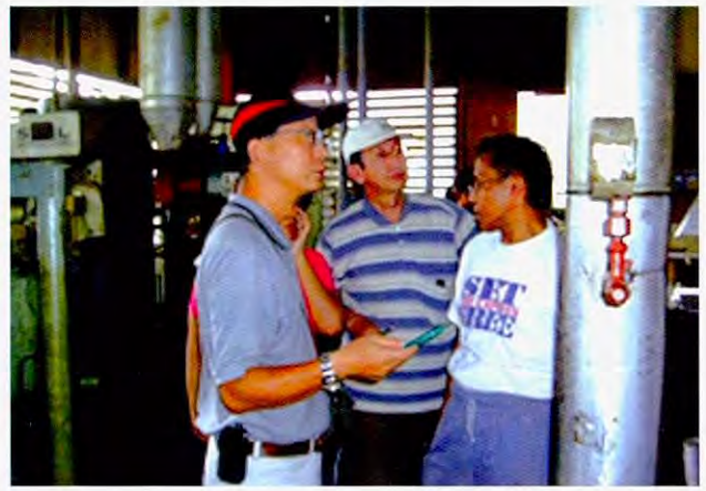
在工厂进行技术指导

首先由科学技术部与ICETT共同制作了环境影响评估用的表格样式和实施方法指南等。然后奔赴各企业, 根据指南要求收集数据, 设定了各企业的达成目标。再由科学技术部职员会同地方行政官员依据表格内容实施了环境影响评估。