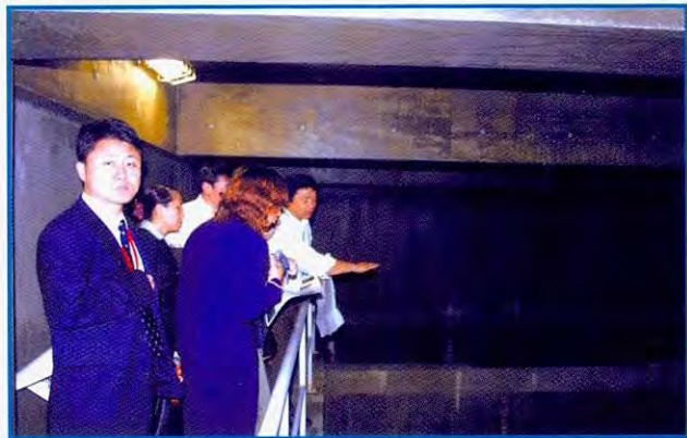
四日市圆顶球场地下的雨水沉淀槽

面临的行政课题中最为重要的课题之一,前一年度该培训主题定为工业排水处理,今年度则是以生活排水为主题来实施的。