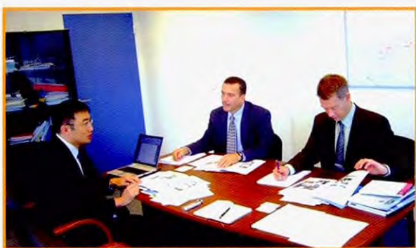
在联合国环境规划署

除此以外,还在EU(法国、德国)开展了调查,主题之一是把本专题讨论会的战略、事业概要、成果(意见总结,专业报告)带到UNEP总部进行发表,接受对本事业的来自外部的评价。另一个主题就是UNEP所倡导的可持续性的消费与生产(Sustainable Consumption and Production: SCP)通过交换意见及通过听取调查活动开展了学习。