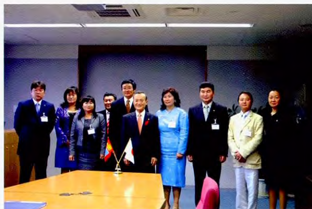
拜会三重县知事(10月2日)

对日本古老的建筑物留下了很深印象。一路上的景色使他们吃惊地感到“日本没有一寸土地是闲着的!”,培训期间有几次去的地方靠海,也有机会访问了港口,对于没有海的蒙古的人们来说,无疑成为了美好的回忆。