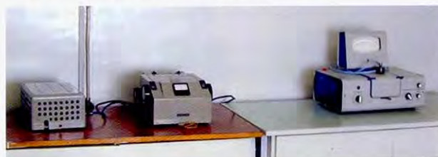
当地的分析仪器一例

以从事水质分析工作的人员为对象,在日本的环境行政与政策背景下理解环境监测的实施体制,同时学习特定的重金属和氮等的分析方法和数据分析,以提高在本国的分析技术水平为其目标。