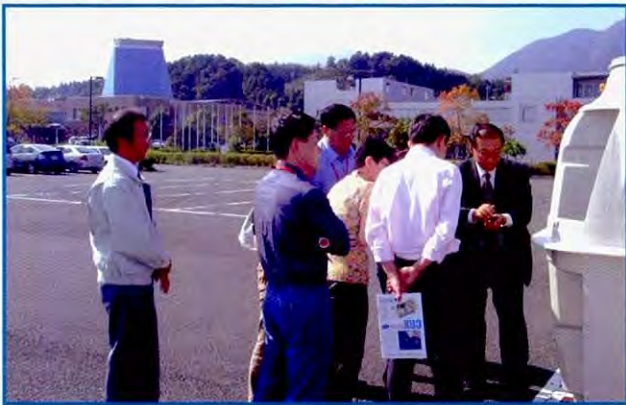
用合并处理净化槽部分样品作解说

培训时间包括出国与回国和其他手续,城市间交通时间都在内总共18天,可以说是很短,而且全体培训人员都是第一次出国。因此,虽然是在环境技术培训这一范围内,ICETT职员还是想让培训人员在这个难得的日本逗留的机会里,尽量多了解日本文化,能够