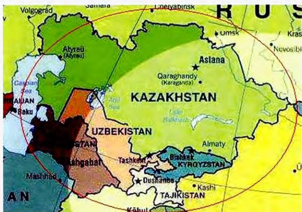
对象国四国的地图

本事业是受独立行政法人国际协力机构(JICA)的委托,以哈萨克斯坦,吉尔吉斯斯坦,塔吉克斯坦,乌兹别克斯坦四国为对象,所实施的三年期的系列培训事业,目的是提高水质分析技术和数据精确度管理。2006年度为最终实施年度。