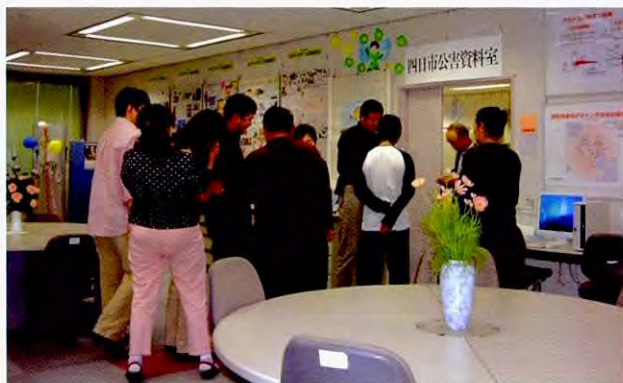
在四日市市的环境学习信息中心

施都有一般居民参加而感到很吃惊,对于这种市民意识来自环境教育有了很深的印象。在乌兰巴托市,虽然行政官员这个层次对于环境问题的意识很高,但除了少数居民以外,都没有什么危机感。培训员对于普及教育活动只要有简单的设备就能充分进行启发活动也留下了深刻的印象。最后还参观了自治体的垃