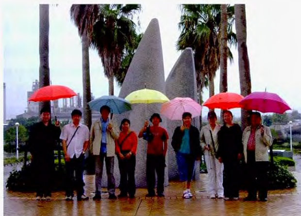
雨中参观四日市港