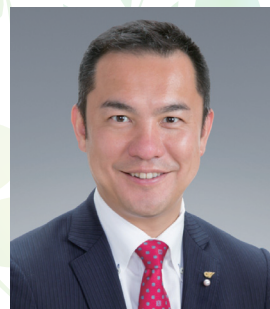
主催者 / 三重県知事 鈴木 英敬