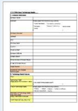
Lembar Data Teknologi