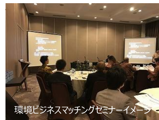
環境ビジネスマッチングセミナーイメージ