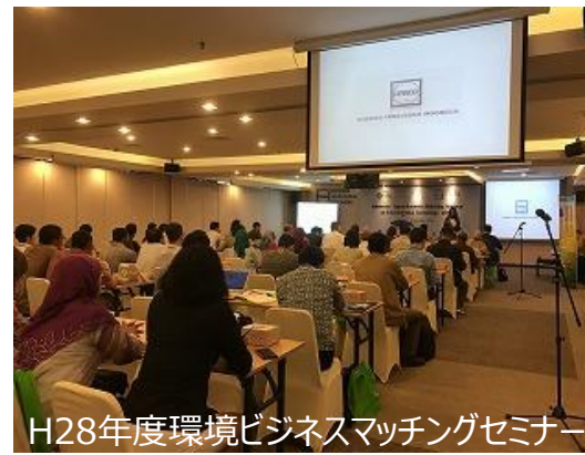
H28年度環境ビジネスマッチングセミナー