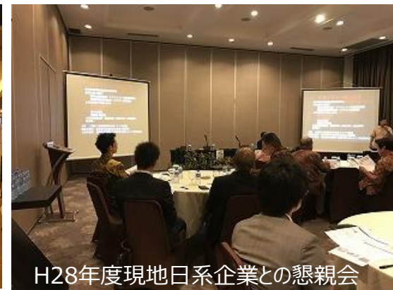
H28年度現地日系企業との懇親会