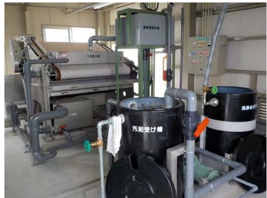
Foto kiri atas adalah tower mesin dan tangki cairan kimia fasilitas pengolahan air limbah, sedangkan foto kanan atas adalah mesin pengering lumpur, dan tangki pengolah berbahan RC yang pemasangannya tertanam di dalam tanah.

Dalam jenis fasilitas manapun, kami menawarkan sistem yang sesuai dengan aturan kualitas air di tempat pembuangan air. Air limbah juga dapat digunakan kembali berkat pengolahan canggih.