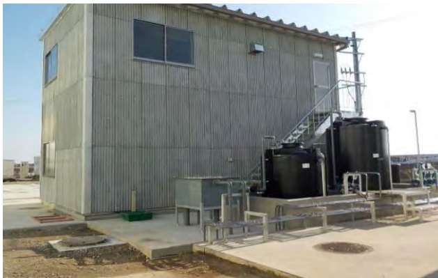
Foto kiri atas adalah fasilitas pengolahan air limbah di pabrik pengolahan daging yang dipasang di permukaan tanah. Terlihat adanya beberapa tangki vertikal. Instalasi di permukaan tanah memungkinkan periode konstruksi yang pendek sehingga cocok untuk perbaikan fasilitas yang telah ada.

Fasilitas ini mengolah dengan berbagai metode yang sesuai untuk masing-masing air limbah yang timbul dari keperluan tertentu, seperti air limbah yang dihasilkan dalam produksi makanan, peternakan, pembersihan, dialisis, dan berbagai proses manufaktur produk.