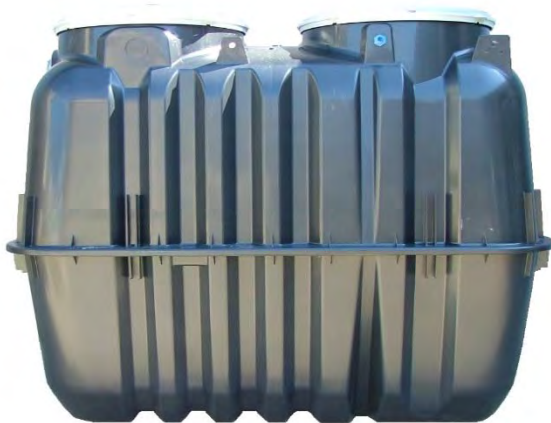
Tangki Pemurnian Air Tipe FCE

Perangkat untuk mengolah air limbah rumah tangga yang berasal dari toilet, dapur, kamar mandi, dll. Sesuai untuk berbagai tempat yang mengeluarkan air limbah rumah tangga.