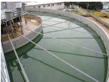
冷凍食品工場 A 社

Nissan Motor (Thailand) 強冠股分企業有限公司(台湾) INDFOOD TSUKISIMA SUKSES MAKMUR CO., LTD. (Indonesia)