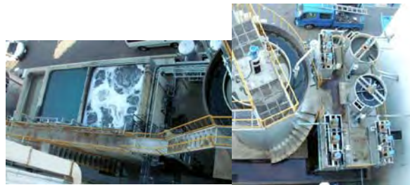
自動車部品工場 E 社